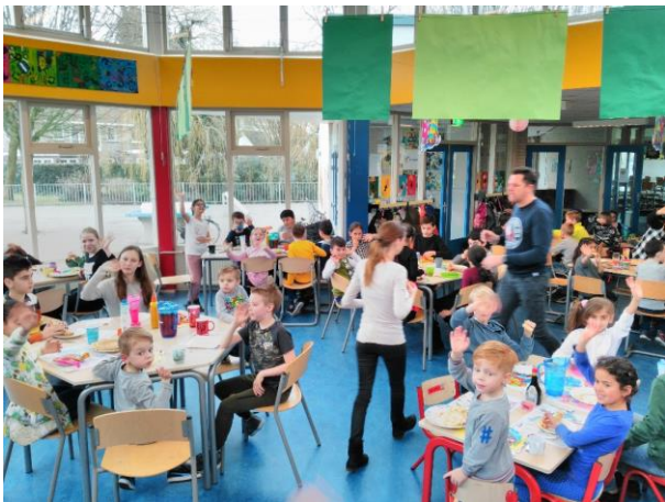
Heerlijk al die pannenkoeken tijdens de lunch.